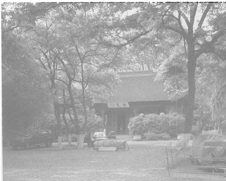
图5.6 南唐在石头山建“石头清凉禅寺”，山因此称清凉山。

个巨大的市场。商业布局除保留传统的大市、小市以外，沿秦淮河两岸临街设置商肆，与手工业作坊相结合形成行业街市，打破传统的封闭型商市格局。由于再次成为东南地区的政治中心，人口增长，金陵产生了强大的消费需求，这刺激了其本地商业贸易的发展；南唐时期，金陵城内多有一些专为居民日常生活服务的市集，多集中在城南地区。宋代的《庆元建康续志》载：“鸡行街，自昔为繁富之地，南唐放进士榜于此。”可见其地是当时南唐的闹市。还有银行是集中打制金陵传统手工业制品金银器之地，花行则是专门制作装饰用花的地方。这些坊原是专门手工行业作坊集中之