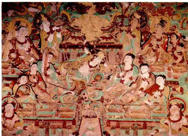
唐朝舞蹈反弹琵琶

药,六六三年重返长安。南天竺僧跋日罗菩提(金刚智),游师子、佛誓(室利佛逝)等国,泛海至广州。唐朝廷敕迎就长安慈恩寺译经。中天竺僧戍婆揭罗僧诃(净师子)经迦湿弥罗至突厥,又经吐蕃来长安。著名的北天竺婆罗门僧阿目佉跋折罗(不空金刚),幼年随叔父来长安,师事金刚智。开元二十年(七三二年)经诃陵、师子国,游五天竺,广求密藏,天宝五载还长安,携回经论五百余部并师子国王表。唐玄宗召见,许翻译所赍梵经,密宗经典由此传布开来。