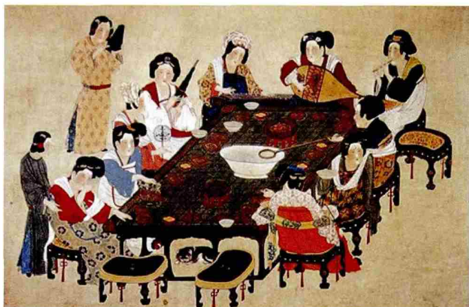
唐代仕女——茶与音乐

长安城内还汇集有大批的外国乐舞人和画师,他们经由不同的途径来到中国,传播着各自的民族艺术。北朝时代,西域乐舞已陆续传入中国,唐代广泛传播。但唐代传入长安的域外艺术,已远不限于西域一隅,而且包括了南亚和东亚的许多国家。