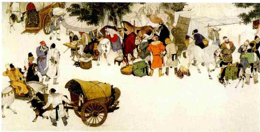
盛唐长安街貌与集市

的任务,在唐代中日文化交流中,作用十分明显。隋末来中国、唐初归日本的留学生高向玄理、僧旻(一作日文)、南渊清安(一作请安)等人,把唐朝的律令制度,介绍回国,日本历史上著名的大化革新,显然与此有密切的关系。革新的中心人物中大兄皇子、中臣镰足,都曾受教于南渊。高向和僧旻任国博士,直接担负