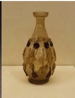
唐朝时来自东罗马地区的琉璃瓶