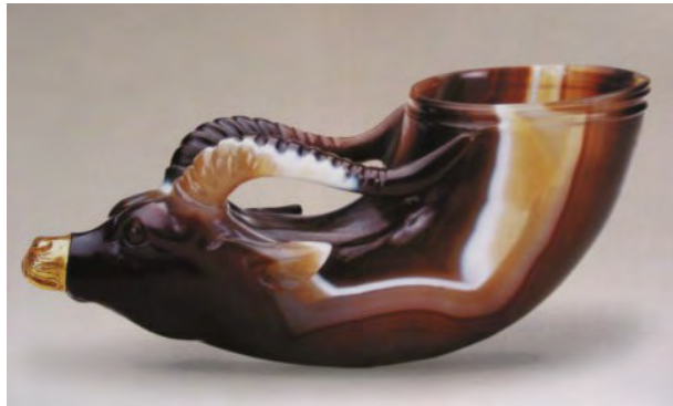
唐代玛瑙兽首杯,中西文化交流的产物。

文学方面: 随着佛教的传入,唐代小说传奇、变文等在内容上更形丰富,韵文方面也因音乐的盛行及佛经中梵文的翻译而对切韵法有所改良,影响到近体诗对格律的追求。